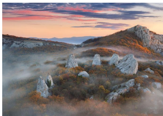
Храм Солнца между мысом Сарыч и Байдарской долиной

После всех наших приключений путеводный клубочек приводит нас в главный храм тавров Богини-матери , прародительницы всего живого. Это – мегалитическое сооружение, самый настоящий Храм Солнца, аналогичный такому же месту силы планетарного масштаба, которое находится между мысом Сарыч и Байдарской долиной. В центре храма Девы находится такой же алтарь, а вокруг располагаются лепестки цветка Храма Солнца. Внешние отличия, конечно, есть, но энергетика такая же. Встаём на центральный камень, посылаем во Вселенную луч любви и света, загадываем желания.