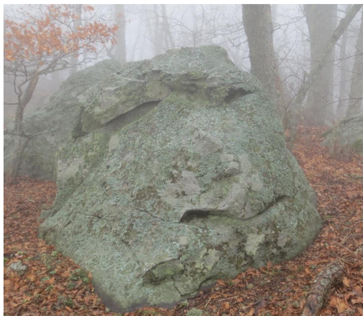
Хозяйка горы, воплотившаяся в камне

Таким образом мы поменяли энергетику пирамиды, она стала генерировать женский поток и работать с общей энергетикой горы в резонансе. А тому, кто славно потрудился откроет свой лик благодарная Хозяйка горы: