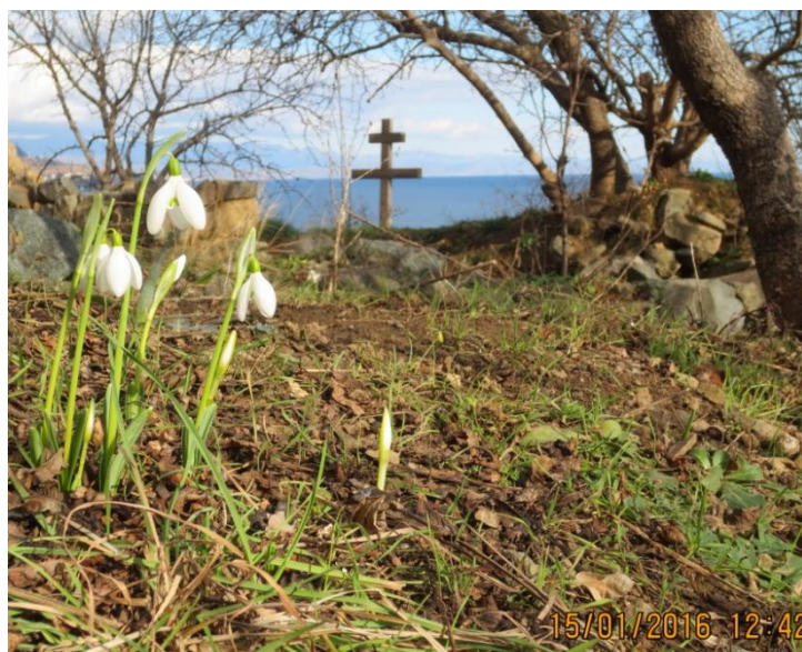
Подснежники возле Древнего Монастыря, 15.01.16 г.