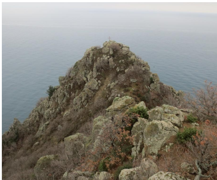
Гора пирамидальной формы – «нос Медведицы»