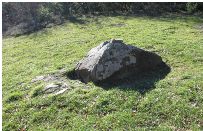
Камень пирамидальной формы на «Энергетической поляне»

Вот и подошло к концу наше путешествие в сказку. Слегка утомлённые, но очень счастливые мы возвращаемся домой.