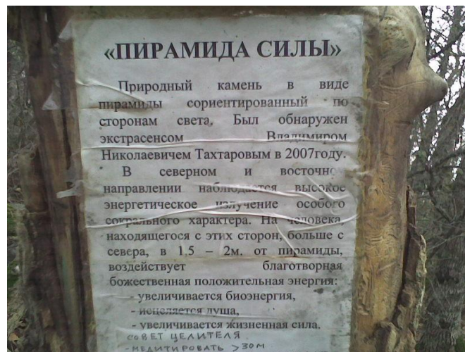
Описание «Пирамиды силы» В.Н. Тахтарова

После всех наших приключений путеводный клубочек приводит нас в главный храм тавров Богини-матери , прародительницы всего живого. Это – мегалитическое сооружение, самый настоящий Храм Солнца, аналогичный такому же месту силы планетарного масштаба, которое находится между мысом Сарыч и Байдарской долиной. В центре храма Девы находится такой же алтарь, а вокруг располагаются лепестки цветка Храма Солнца. Внешние отличия, конечно, есть, но энергетика такая же. Встаём на центральный камень, посылаем во Вселенную луч любви и света, загадываем желания.