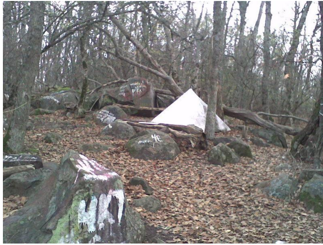
«Пирамида силы» В.Н. Тахтарова