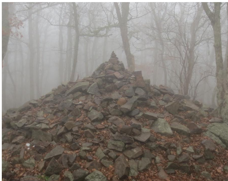
Тур из каменных глыб – «сердце Медведицы»

Наш паломнический путь начнётся с подъёма на гору по проложенной тропе. Оказавшись наверху, мы пройдем через сказочный вещей лес к самому сердцу горы, где увидим сложенный из каменных глыб тур: